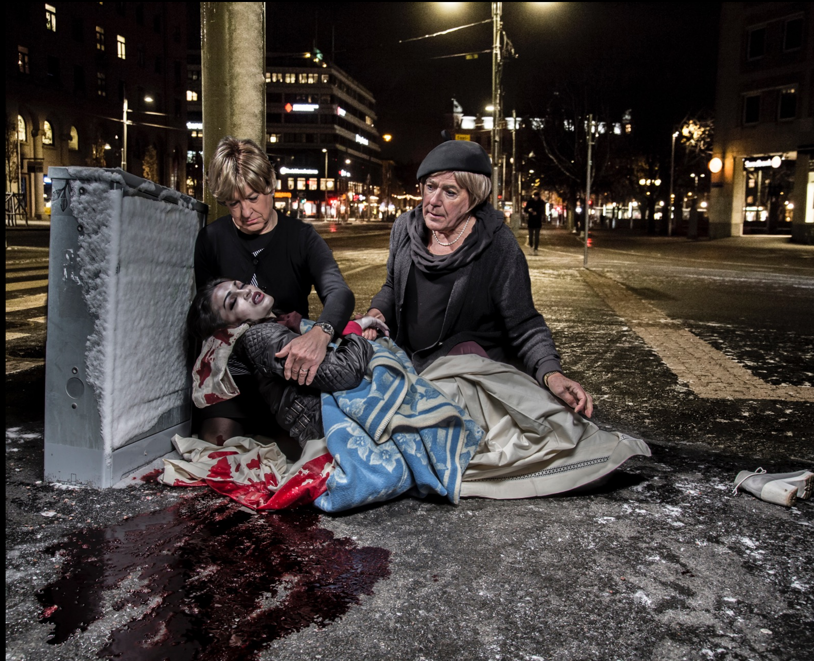
Samariten av Elisabeth Ohlson Wallin från utställningen id:TRANS.