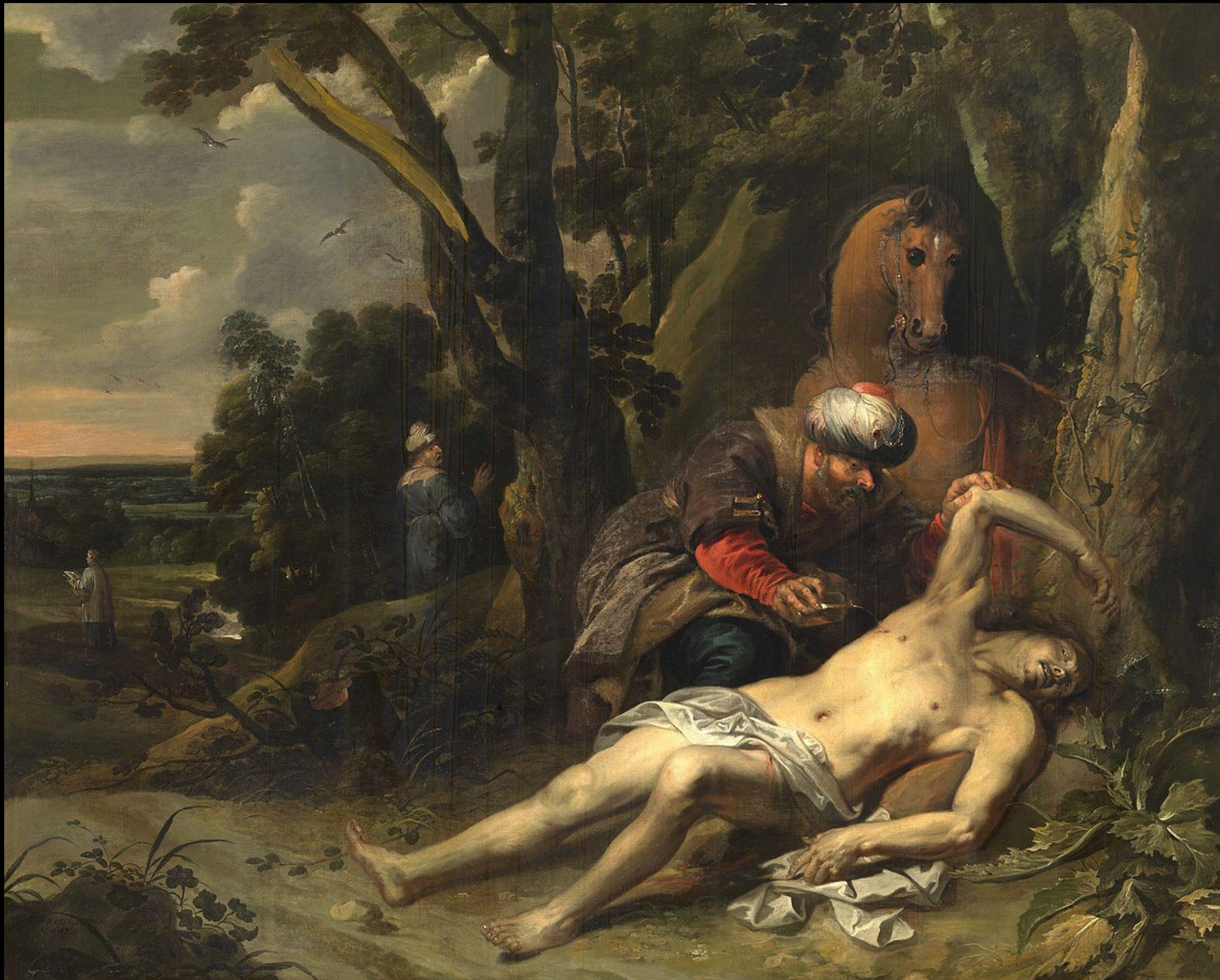
Målningen Den barmhärtige samariten av Balthasar van Cortbemde (1647)