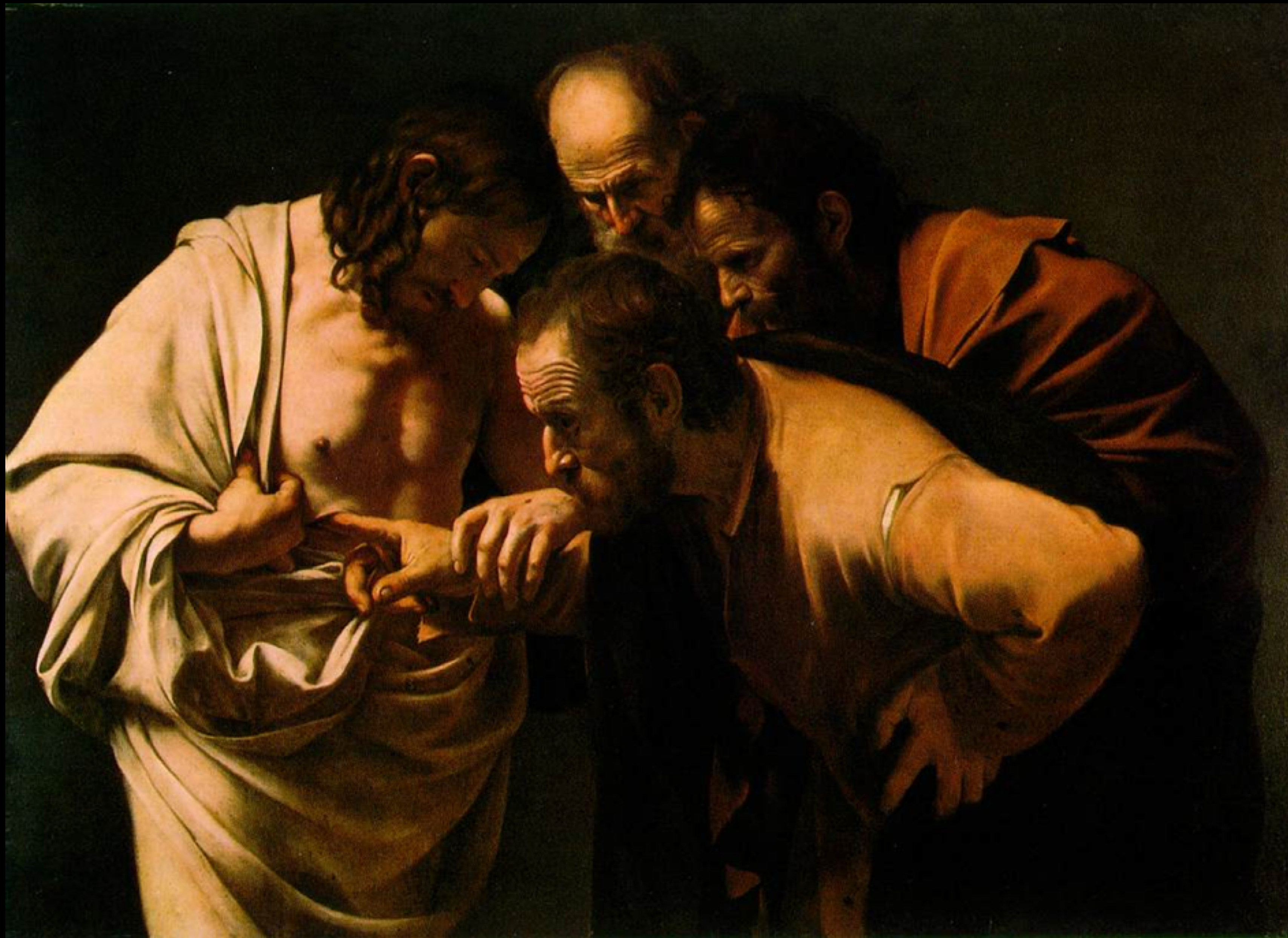
Den tvivlende Tomas. Caravaggio (1601–1602)