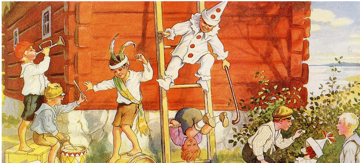
Bild: Kalles Cirkusföreställning, Jenny Nyström