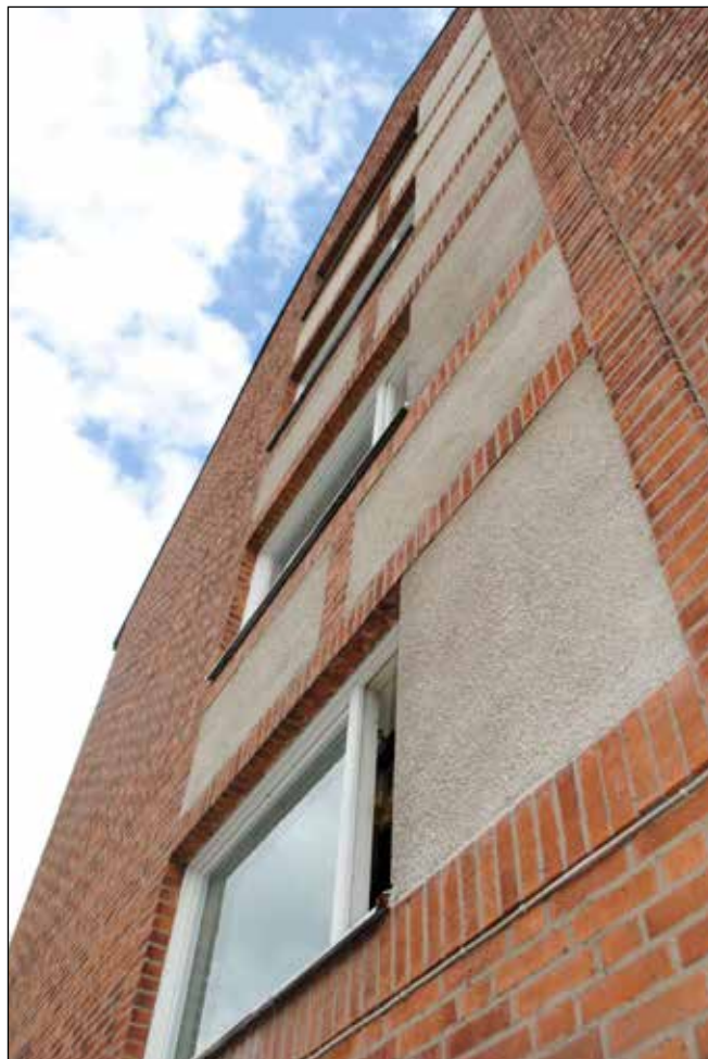
Flera fasadmaterial som möttes präglade 1950-talet. Putsade fält i anslutning till fönsterpartier blev ett vanligt uttryck.

Det är viktigt att hålla stuprör och plåtavtäckningar i gott skick för att undvika fuktskador. Putsskador är oftast lokala och det är ofta onödigt att måla om hela huset. Knacka då ner lös puts samt bomytor (ytputs utan kontakt med underlaget, låter ihåligt vid knack-