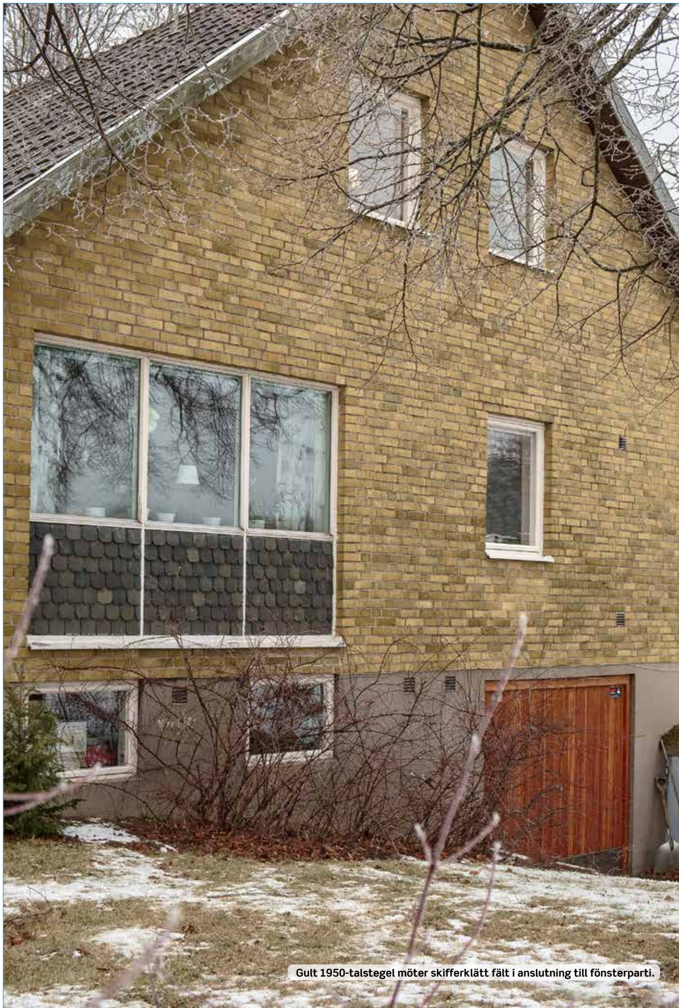
Gult 1950-talstegel möter skifferklätt fält i anslutning till fönsterparti.