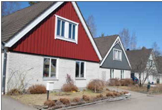
1970-talets fasader präglas inte sällan av rött tegel och brunmålad träpanel eller (nedre bilden) s k mexিতেgel i kombination med gavelspetsar i trä.