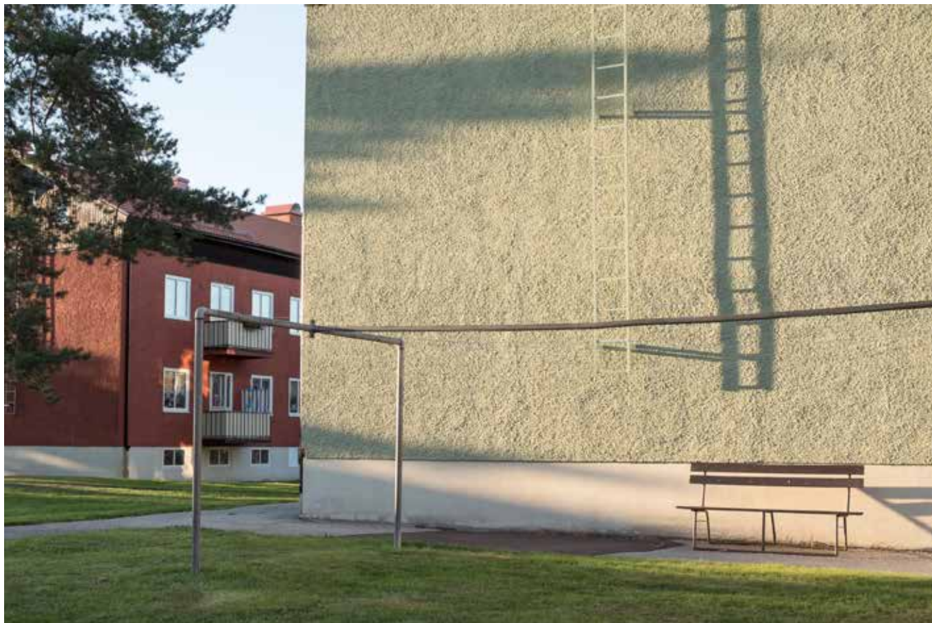
1940-talet innebar åter mer traditionella karaktärsdrag. Varma, mustiga fasadkulörer och bostadsområden med individuellt kulörsatta hus.