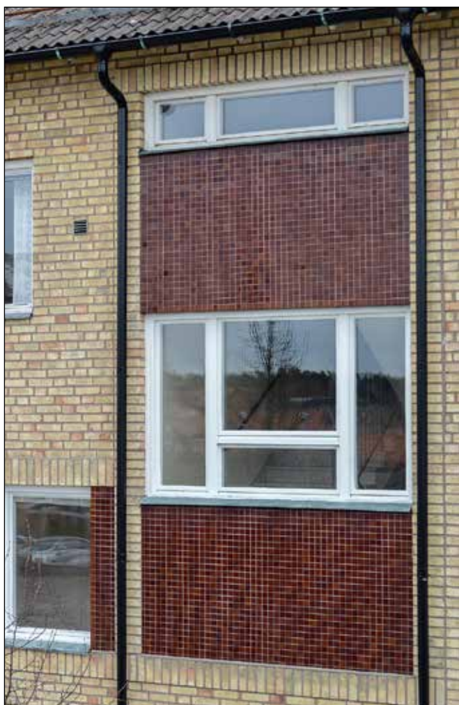
Avgränsade fält eller hela fasadpartier klädda med mosaik bidrog till att skapa inte minst 1950-talets omväxlingsrika fasader.

Funktionalismens villor gavs ofta kubliknande former och slät ljus puts. Fönstersättningen var oregelbunden, styrd av planlösningen.