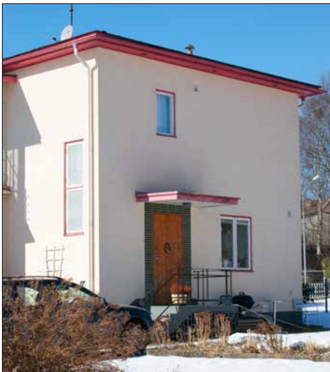
1930-talets villor gavs ofta kublika former och slät ljus puts.

Modernismens byggnader har ofta ganska få dekorativa detaljer. Att vara rädd om grundläggande funktionella byggnadsdelar som fönster, entréer och balkonger betyder därför särskilt mycket. Dessa står för betydande delar av det tidstypiska uttrycket.